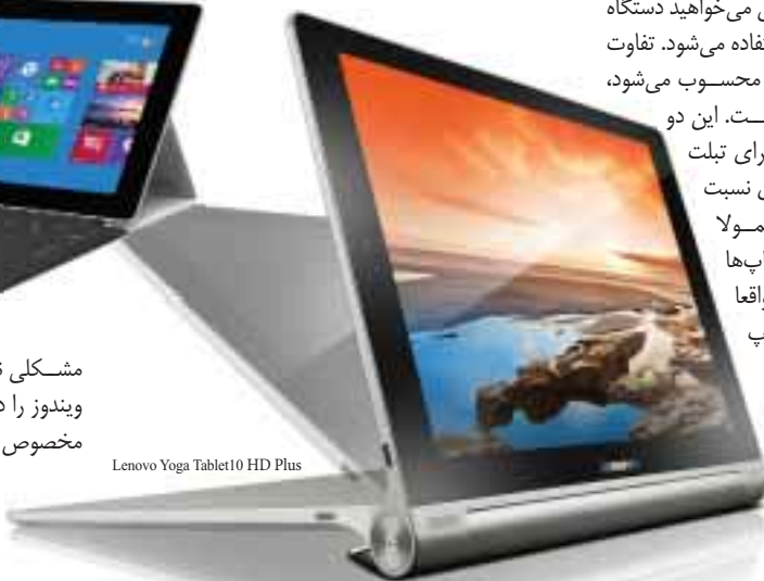
Lenovo Yoga Tablet10 HD Plus

می‌زند، ولی اگر با ویندوز ۸/۱ مشکلی ندارید، سرفیس پرو ۲ بهترین رابط کاربری ویندوز را دارد و عملاً در این مدل از همه نرم‌افزارهای مخصوص رایانه می‌توان استفاده کرد.