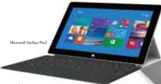
Microsoft Surface Pro2