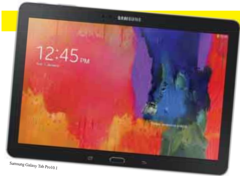
Samsung Galaxy Tab Pro10.1

در کل، مدل تپ پرو از نظر نرم‌افزار از یوگا جلو